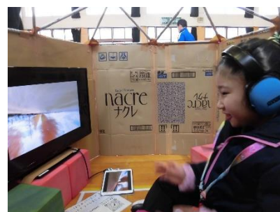
紙に印刷したQRコードをタブレット型端末で読み取ることで、モニターから動画が流れる仕組みです。