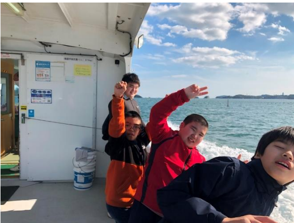
遊覧船最高でした。

事前学習を含めて様々なことを経験し、たくさんのことを学ぶことができた修学旅行になりました。