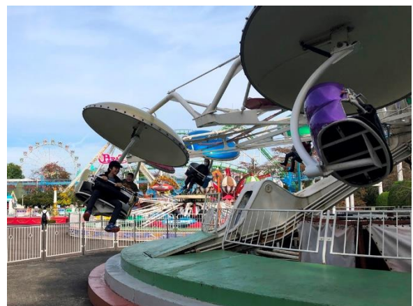
アトラクション楽しかったです。