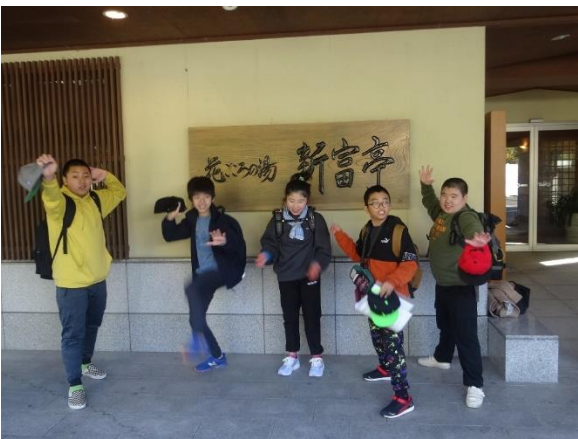
一晩お世話になりました。