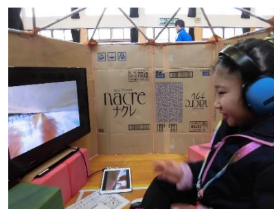
紙に印刷したQRコードをタブレット型端末で読み取ることで、モニターから動画が流れる仕組みです。