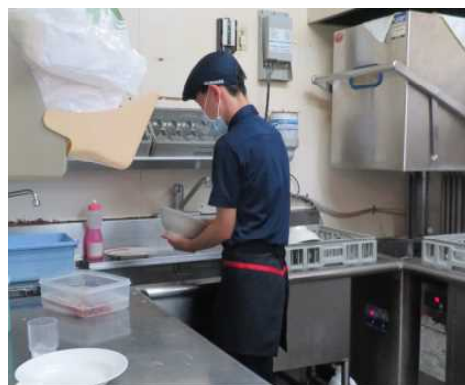
現場実習： 食器洗いをする高等部3年生 （幸楽苑）

この実習は、日常生活や学校生活で学んできたことが、どのくらい身に付いているのかを実際に働く場で試す機会として行っています。将来の社会自立に向け、自分の得意なことや苦手なことに気づき、これからの生活や学習の中での目標を再確認することができました。